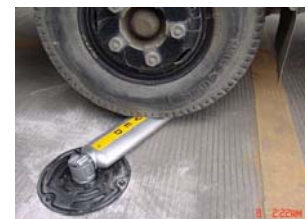
萬向迴轉底座於卡車撞擊時發生保護作用